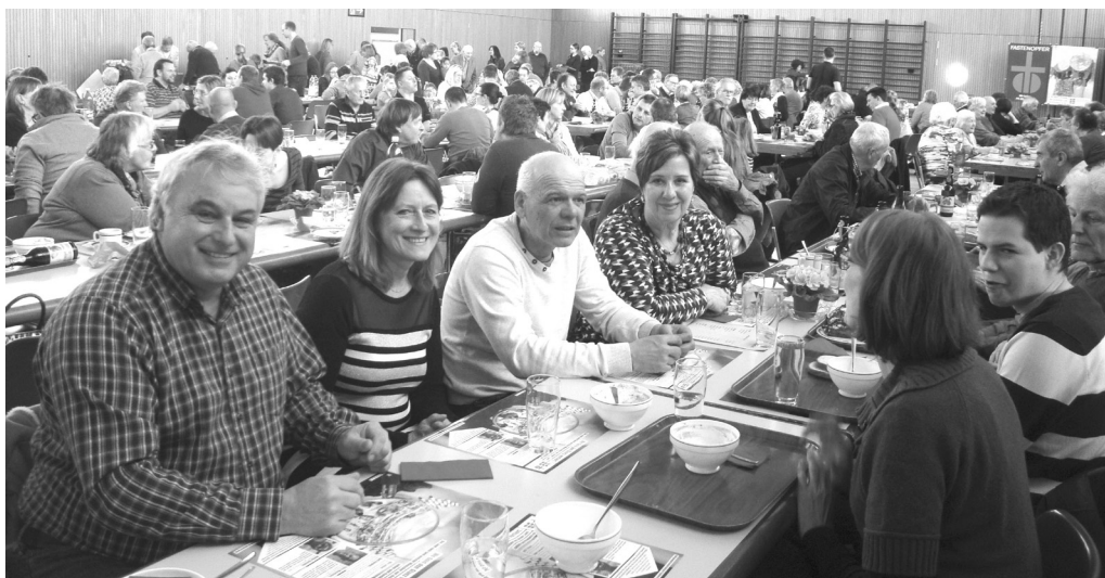
Ökumenischer Suppentag Au

In Heerbrugg wurde zum 40. Male zum «Sonntag am gliche Tisch» eingeladen. Am 21. Februar durften die Kinder aktiv mitwirken in unserem ökumenischen Gottesdienst. Anschliessend gab es im Pfarreiheim die gute Gerstensuppe, Wienerli mit Pommes Frites und das gewohnt extrafeine Dessert-Buffer. Zu diesem Jubiläumsanlass waren die Initianten von damals eingeladen. Unterstützt wurde ein Projekt im Kongo, das sich für den Schutz der Bevölkerung und der Natur beim Abbau der Bodenschätze einsetzt. Mit den Spenden beim Suppentag wird diesen Menschen geholfen. Allen ein herzlicher Dank für ihr Kommen, ihr Dabeisein und damit für ihr Mittragen dieses so wichtigen Anliegen.