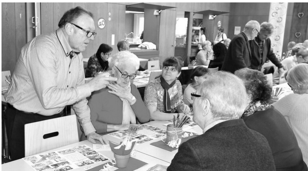
Ökumenischer Suppentag Heerbrugg