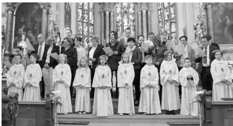
Erstkommunion in Berneck

Text: Bruno Dietrich