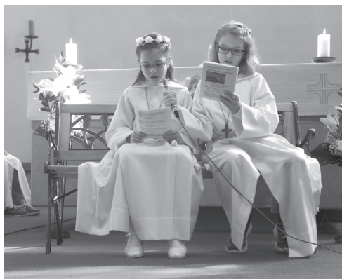
Erstkommunion, Weisser Sonntag, 10 April