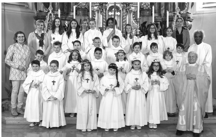
Erstkommunion in Au