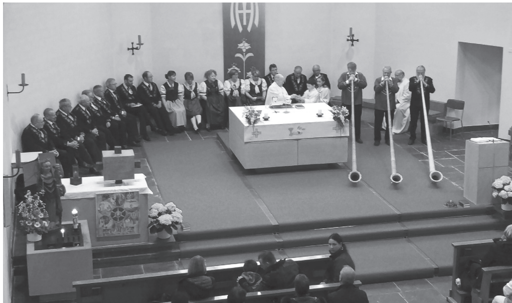
Eindrücke von der Jodlermesse am 1. Mai.