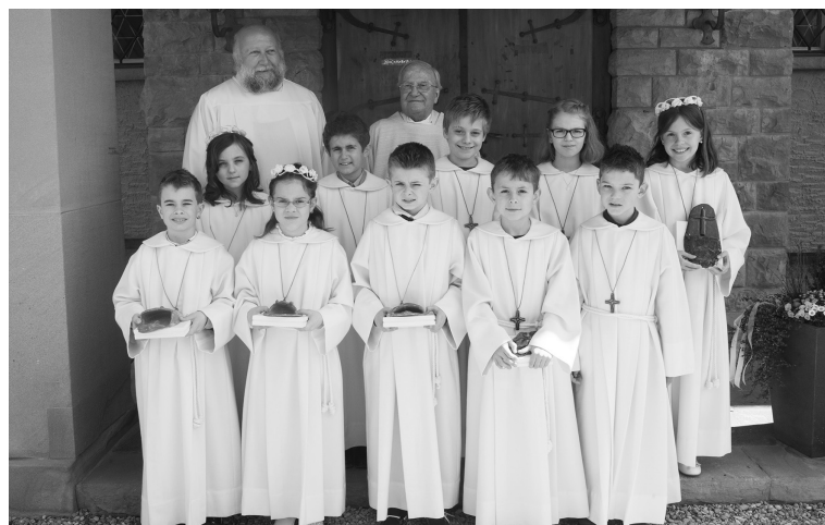
Erstkommunion in Heerbrugg

Text: Reinhard Paulzen