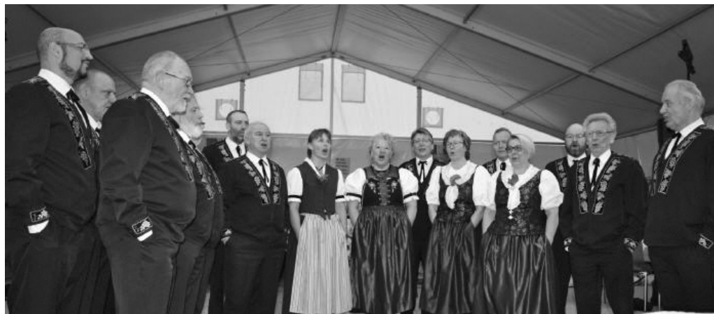
Jodelchörli Berneck beim Markt-Gottesdienst in Heerbrugg.